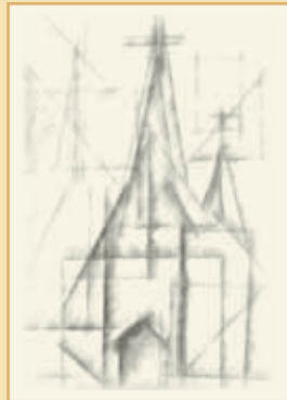
KK 44 Torsten Peter Feiningerg-Kirche