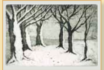
KK 43 Olaf Breier