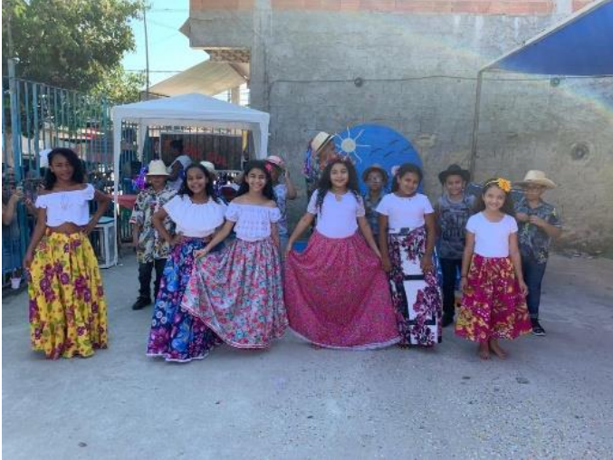
Präsentation der Kinder der 3. Klasse