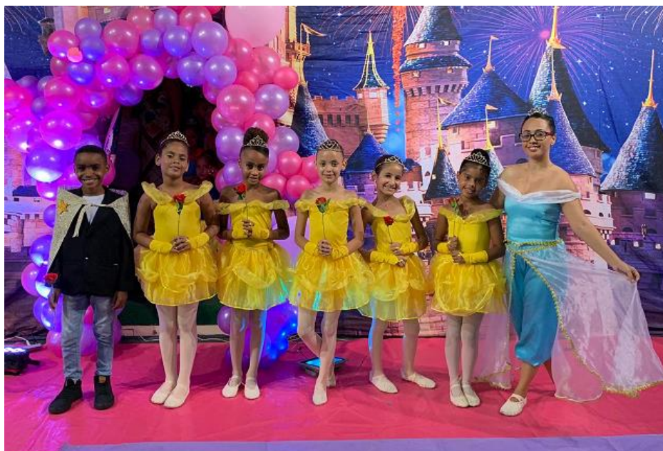
Auftritt der Ballerinas in 2019