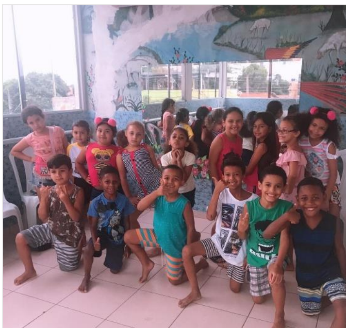
Ein Teil der neuen Chor-Kinder der Schule

Grundschule Escola Comunitaria “Caminhos do Saber - Wege zum Wissen“ Vila Nova, Rio de Janeiro