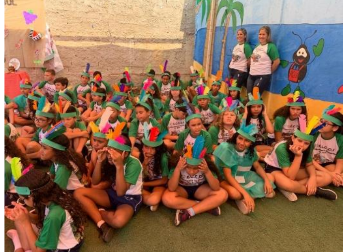
1. Klasse, 4. Klasse und 5. Klasse