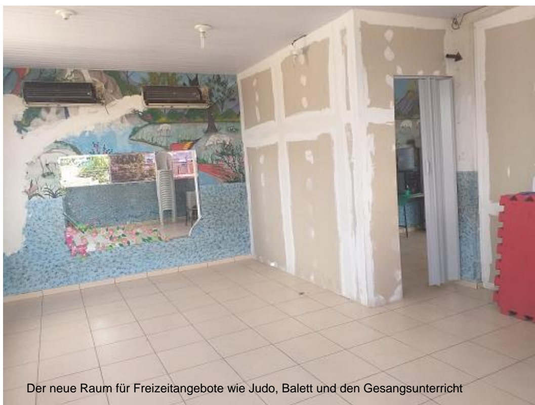
Der neue Raum für Freizeitangebote wie Judo, Ballett und den Gesangsunterricht

Im Namen der Schule, der Kinder und dem Team von Ourchild e.V. sagen wir den Spender*innen von ganzem Herzen - DANKESCHÖN !