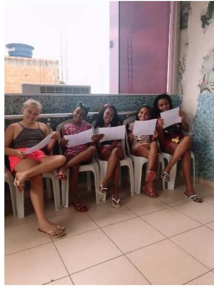
Kinder beim Gesangsunterricht in dem neuen Raum

Ourchild e.V. dankt allen Paten und Patinnen für ihre langjährige nachhaltige Spende für dieses überaus wichtige Schulprojekt in Rio de Janeiro!